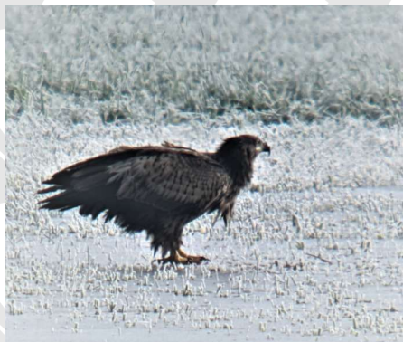
Pygargue à queue blanche

(Observations communiquées par le groupe « Biodiversité » de l'AMD)